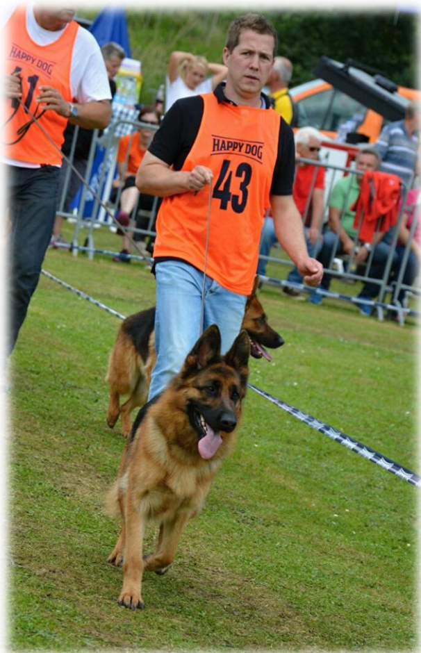
SG 1 JHKLH Destiny vom Aurelisbrandt