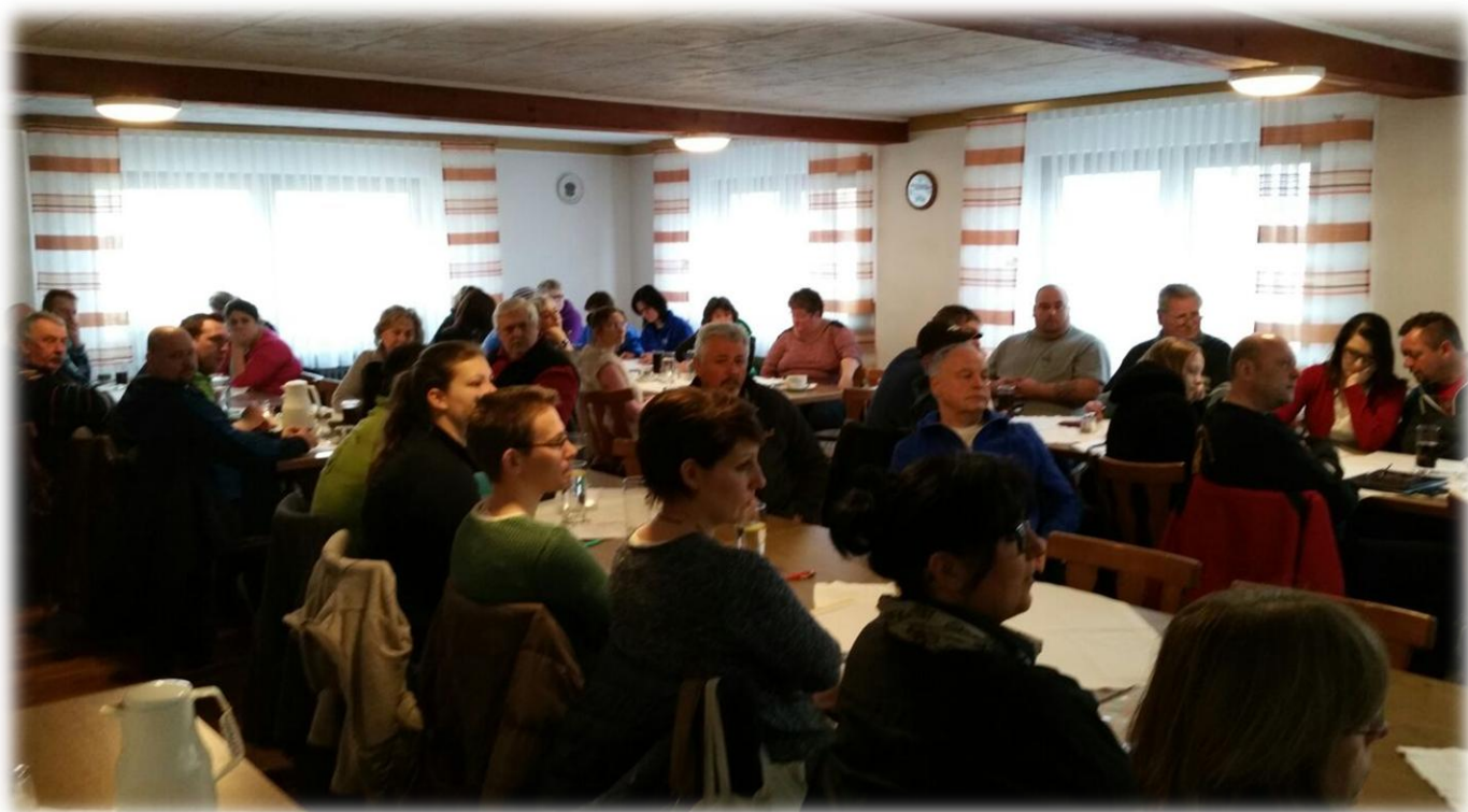
Ein Teil unserer neuen "Übungsleiter"