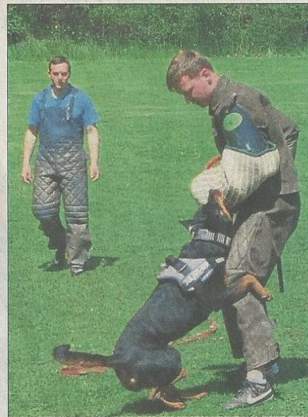
Abfangtechnik wird erlernt.